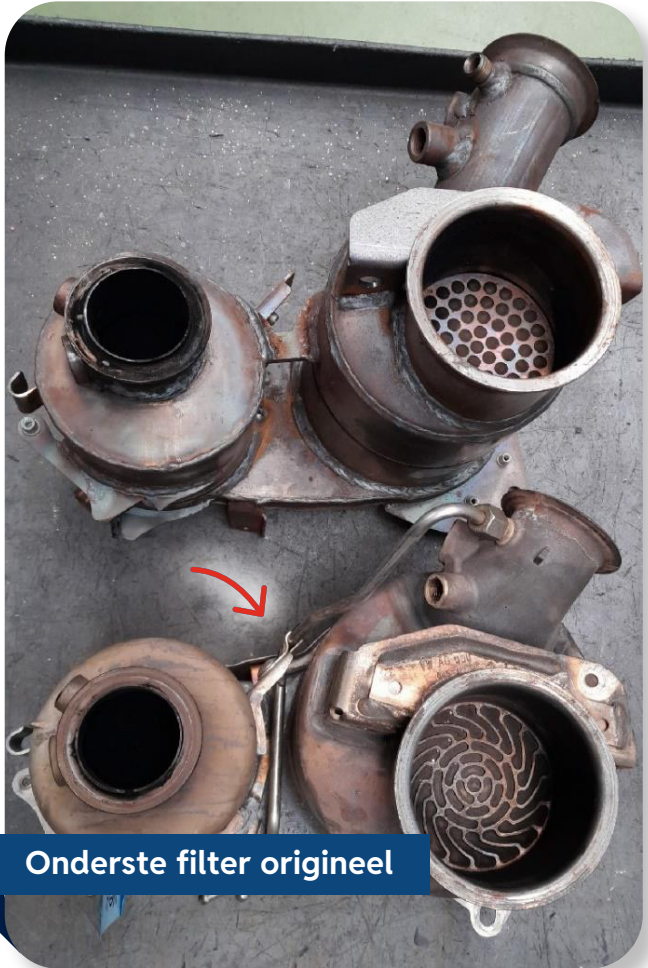
Onderste filter origineel